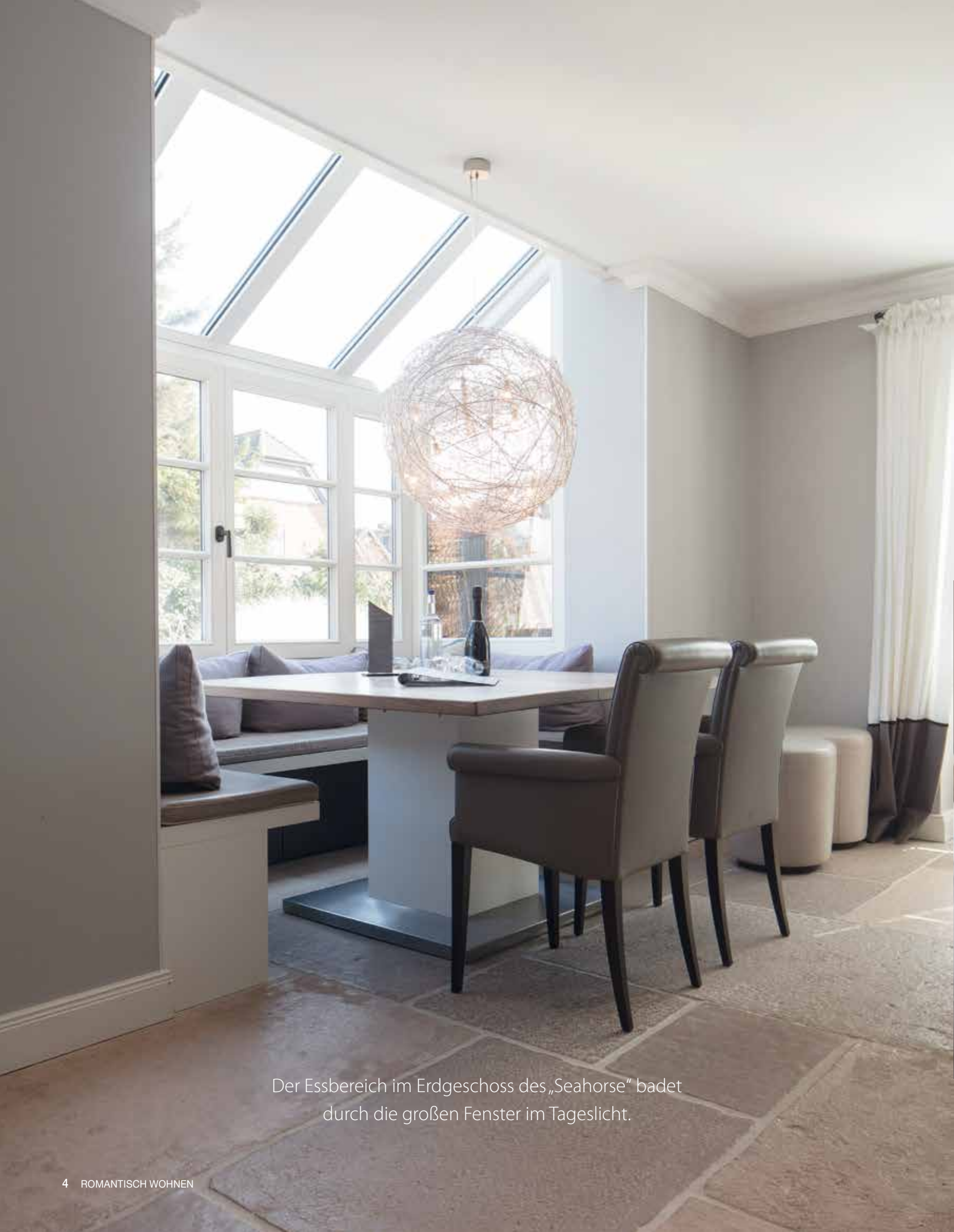
Der Essbereich im Erdgeschoss des „Seahorse“ badet durch die großen Fenster im Tageslicht.